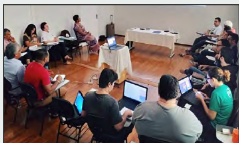
Segunda reunião presencial do Conselho Nacional