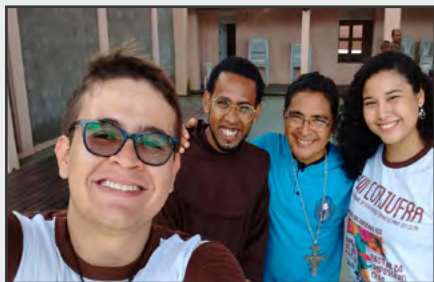
JUFRA na Assembleia do Setor Juventudes, em Fortaleza - CE.