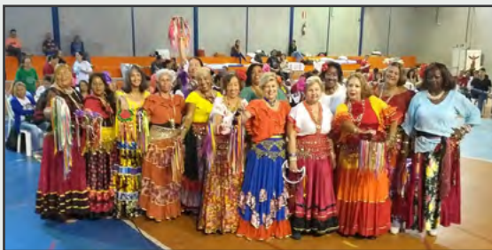
Noite cultural do II Encontro Regional de Formação OFS/JUFRA