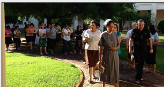
CERNEF - Agudos - SP