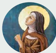
Santa Clara de Assis

6 Por isso, queridas Irmãs, devemos considerar os imensos benefícios que Deus nos concedeu, 7 mas, entre outros, aqueles que Ele se dignou realizar em nós por seu dileto servo, nosso pai São Francisco, 8 não só depois de nossa conversão mas também quando estávamos na miserável vaidade do mundo. 9 Pois, quando o santo, logo depois de sua conversão, sem ter ainda irmãos ou companheiros, 10 estava construindo a igreja